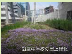
銀座中学校の屋上緑化